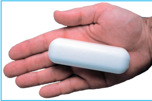
Abbildung 1: P-PILL®-Phosphor-Pille. 750 mmol Phosphor aus Natriumphosphat.